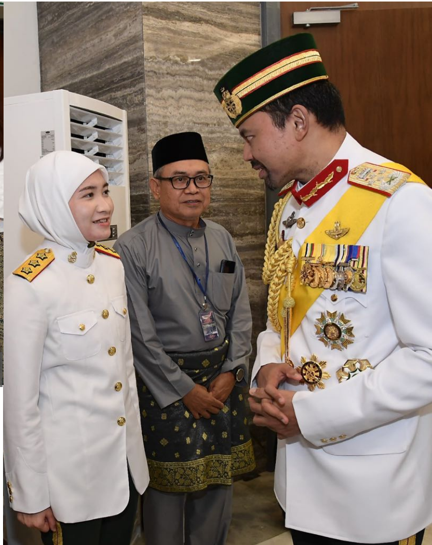
DYTM Paduka Seri Pengiran Muda Mahkota Pengiran Muda Haji Al-Muhtadee Billah berkenan bergambar bersama Pegawai Sekolah Pegawai Kadet pengambilan ke-19

Baginda juga bertitah agar semua pegawai kadet yang ditauliahkan untuk sentiasa menjaga disiplin dan tahap profesionalisme masing-masing, di samping sentiasa memelihara pegangan kerohanian untuk mendapatkan rahmat dan perlindungan Allah Subhanahu Wa-Ta'ala daripada gejala-gejala buruk.