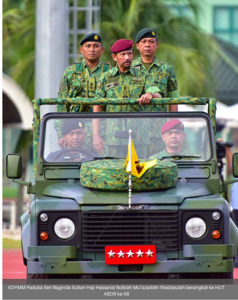
KDYMM Paduka Seri Baginda Sultan Haji Hassanal Bolkiah Mu'izzaddin Waddaulah berangkat ke HUT ABDB ke-58

Sambutan Hari Ulang Tahun (HUT) ABDB yang disambut setiap tahun setentunya merupakan hari istimewa khususnya bagi menghargai pengorbanan para warga ABDB berserta keluarga, sama ada yang masih berkhidmat, mahupun yang telah bersara, di samping memperingati anggota ABDB yang telah tiada.