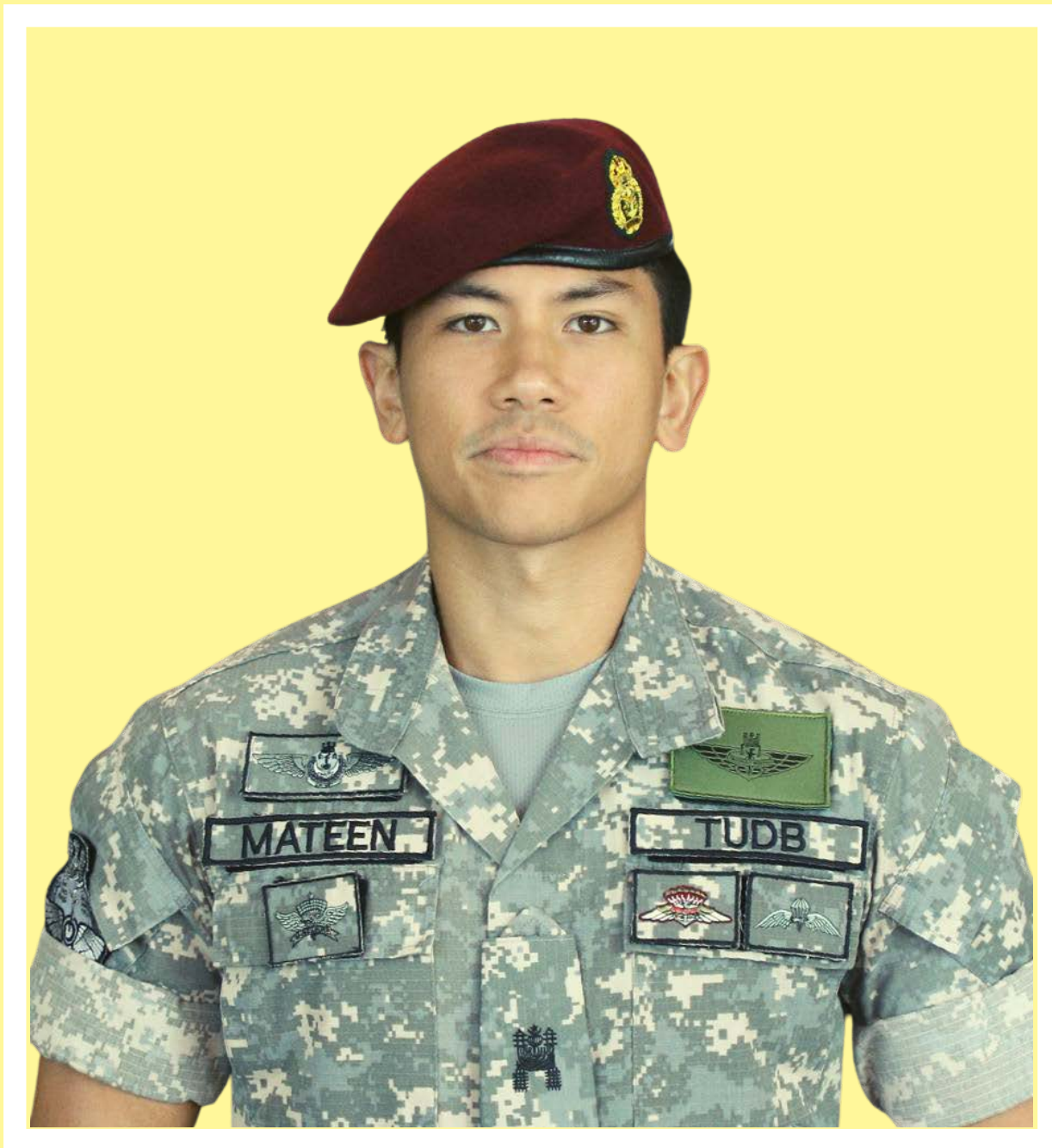
Duli Yang Teramat Mulia Paduka Seri 920 Mejar (U) Pengiran Muda 'Abdul Mateen ibni Kebawah Duli Yang Maha Mulia Paduka Seri Baginda Sultan Haji Hassanal Bolkiah Mu'izzaddin Waddaulah