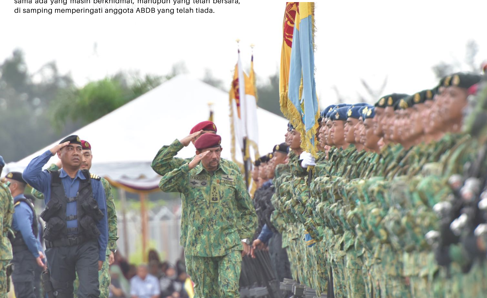
KDYMM Paduka Seri Baginda Sultan Haji Hassanal Bolkiah Mu'izzaddin Waddaulah berangkat ke HUT ABDB ke-56