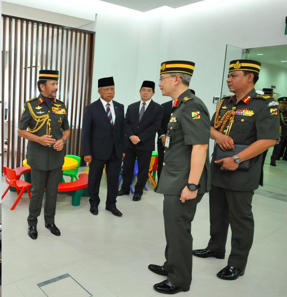
KDYMM Paduka Seri Baginda Sultan Haji Hassanal Bolkiah Mu'izzaddin Waddaulah berangkat ke TDDB