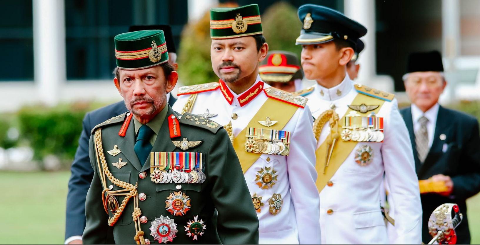
KDYMM Paduka Seri Baginda Sultan Haji Hassanal Bolkiah Mu'izzaddin Waddaulah, DYTM Paduka Seri Pengiran Muda Mahkota Pengiran Muda Haji Al-Muhtadee Billah dan DYTM Paduka Seri 920 Mejar (U) Pengiran Muda 'Abdul Mateen berkenan berangkat ke Sekolah Pegawai Kadet pengambilan ke-19