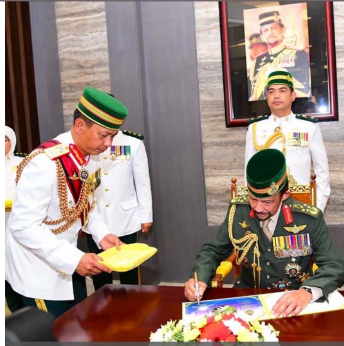
KDYMM Paduka Seri Baginda Sultan Haji Hassanal Bolkih Mu'izzaddin Waddaulah menandatangani lembaran kenangan SPK pengambilan ke-17

Pada Sovereign's Parade Pengambilan ke-19 tahun 2021, Baginda menekankan agar Angkatan Bersenjata Diraja Brunei (ABDB) mengambil ingatan bahawa perkembangan teknologi berupaya untuk mengimbangi kekurangan tenaga kerja. "Aplikasi teknologi juga perlu diberi perhatian untuk meningkatkan kecekapan dan keberkesanan pengurusan pentadbiran dan kebolegunaan", titah Baginda lagi.