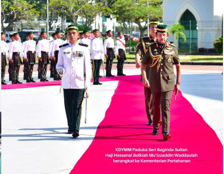
KDYMM Paduka Seri Baginda Sultan Haji Hassanal Bolkiah Mu'izzaddin Waddaulah berangkat ke Kementerian Pertahanan

Isnin, 30 September 2019 - Kebawah Duli Yang Maha Mulia Paduka Seri Baginda Sultan Haji Hassanal Bolkiah Mu'izzaddin Waddaulah, Sultan dan Yang Di-Pertuan Negara Brunei Darussalam, berkenan mengadakan lawatan kerja pada 26 September 2019 ke Angkatan Bersenjata Diraja Brunei (ABDB). Manakala pada 30 September 2019 Tentera Udara Diraja Brunei (TUDB) di Pangkalan Tentera Udara, Rimba dan Pangkalan Tentera Laut Diraja Brunei (TLDB).