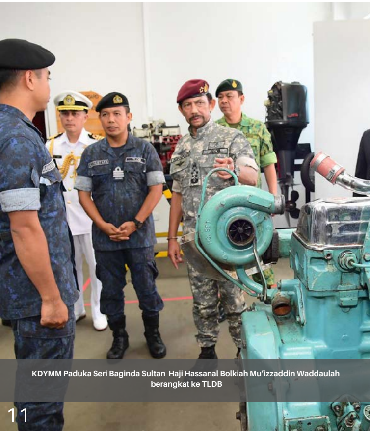
KDYMM Paduka Seri Baginda Sultan Haji Hassanal Bolkiah Mu'izzaddin Waddaulah berangkat ke TLDB