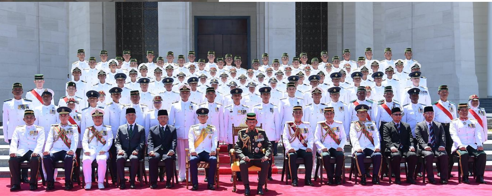
KDYMM Paduka Seri Baginda Sultan Haji Hassanal Bolkiah Mu'izzaddin Waddaulah dan DYTM Paduka Seri 920 Mejar (U) Pengiran Muda 'Abdul Mateen berkenan bergambar ramai bersama Pegawai-Pegawai Sekolah Pegawai Kadet pengambilan ke-18