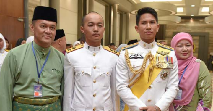
DYTM Paduka Seri 920 Mejar (U) Pengiran Muda 'Abdul Mateen berkenan bergambar bersama Pegawai Sekolah Pegawai Kadet pengambilan ke-19

“Semenjak satu dekad penubuhannya, Sekolah Pegawai Kadet Akademi Pertahanan, ABDB telah berjaya melahirkan seramai 523 pegawai tentera yang bertauliah. Majoriti daripada mereka ini, ada yang telah memegang jawatan-jawatan penting dalam unit-unit ABDB, di samping ada juga yang telah berkhidmat di Sekolah Pegawai Kadet sebagai Intake Commander ,” titah Baginda pada tahun 2020.