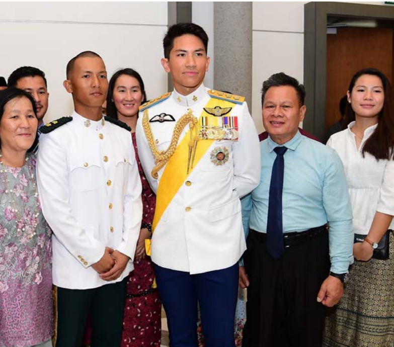
DYTM Paduka Seri 920 Mejar (U) Pengiran Muda 'Abdul Mateen berkenan bergambar bersama Pegawai Sekolah Pegawai Kadet pengambilan Ke-17