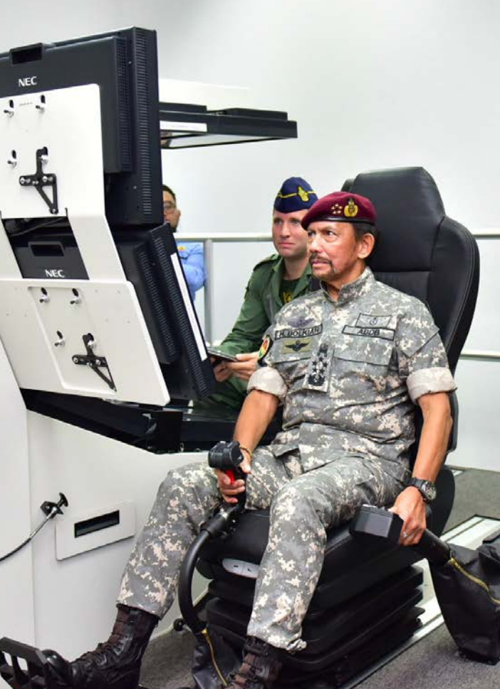
KDYMM Paduka Seri Baginda Sultan Haji Hassanal Bolkiah Mu'izzaddin Waddaulah berangkat ke TUDB