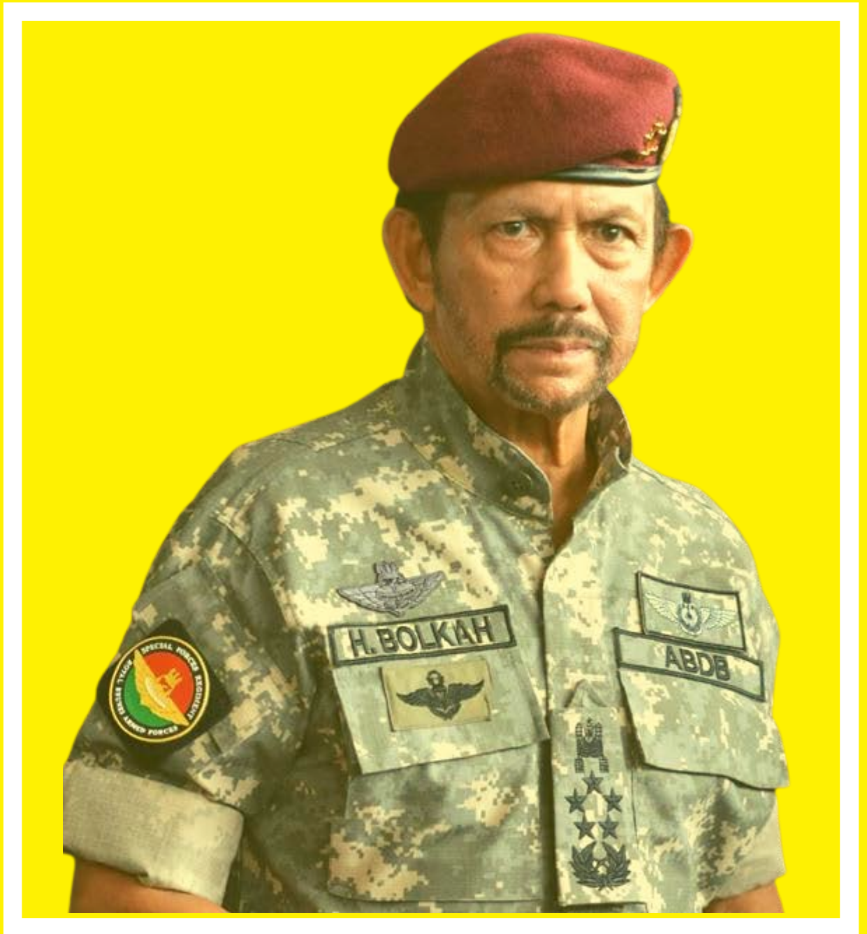
Kebawah Duli Yang Maha Mulia Paduka Seri Baginda Sultan Haji Hassanal Bolkiah Mu'izzaddin Waddaulah ibni Al-Marhum Sultan Haji Omar 'Ali Saifuddien Sa'adul Khairi Waddien, Sultan Dan Yang Di-Pertuan Negara Brunei Darussalam