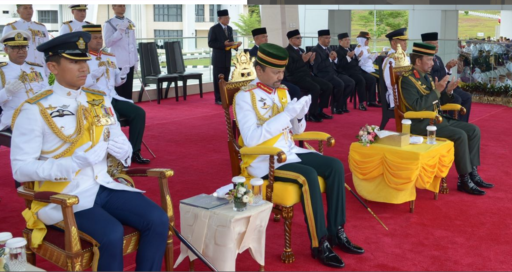
KDYMM Paduka Seri Baginda Sultan Haji Hassanal Bolkiah Mu'izzaddin Waddaulah, DYTM Paduka Seri Pengiran Muda Mahkota Pengiran Muda Haji Al-Muhtadee Billah dan DYTM Paduka Seri 920 Mejar (U) Pengiran Muda 'Abdul Mateen berkenan berangkat menyaksikan perbarisan Sekolah Pegawai Kadet pengambilan ke-19

Baginda juga bertitah agar semua pegawai kadet yang ditauliahkan untuk sentiasa menjaga disiplin dan tahap profesionalisme masing-masing, di samping sentiasa memelihara pegangan kerohanian untuk mendapatkan rahmat dan perlindungan Allah Subhanahu Wa-Ta'ala daripada gejala-gejala buruk.