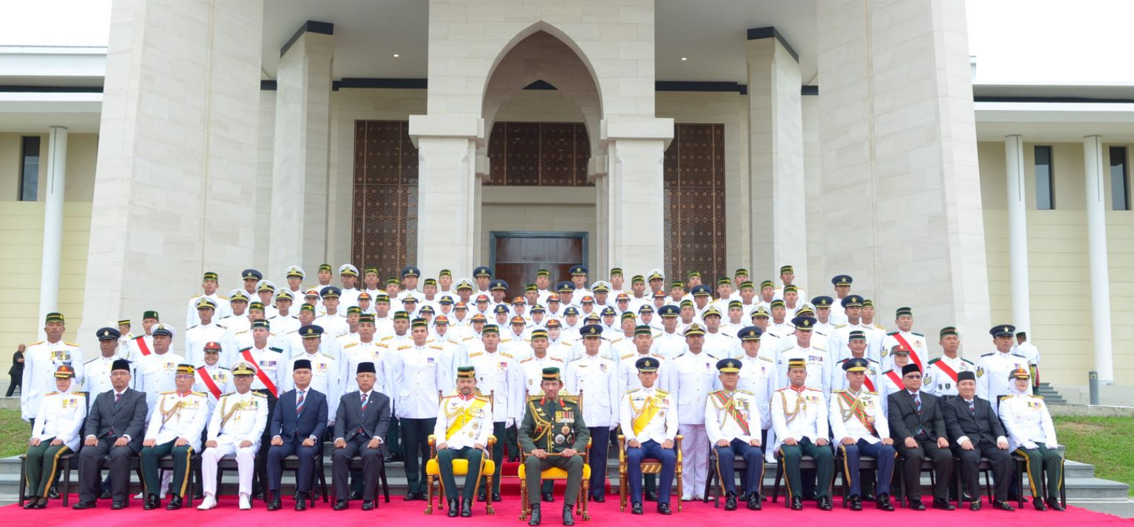
KDYMM Paduka Seri Baginda Sultan Haji Hassanal Bolkih Mu'izzaddin Waddaulah, DTYM Paduka Seri Pengiran Muda Mahkota Pengiran Muda Haji Al-Muhtadee Billah dan DTYM Paduka Seri 920 Mejar (U) Pengiran Muda 'Abdul Mateen berkenan bergambar ramai bersama Pegawai-Pegawai Sekolah Pegawai Kadet pengambilan ke-19