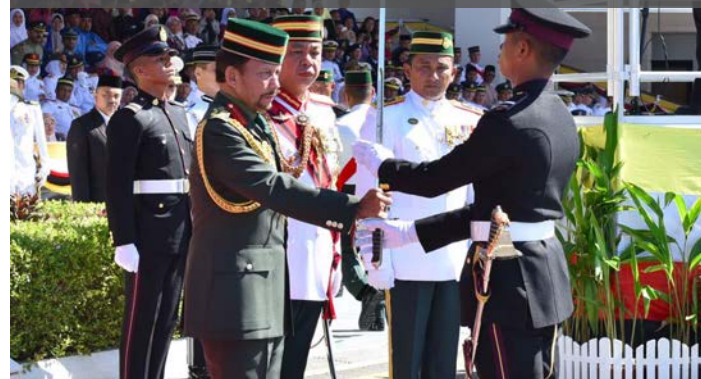
KDYMM Paduka Seri Baginda Sultan Haji Hassanal Bolkih Mu'izzaddin Waddaulah mengurniakan Anugerah Pedang Kehormatan kepada Pegawai Kadet

1961-2021 ANGKATAN BERSENJATA DIRAJA BRUNEI