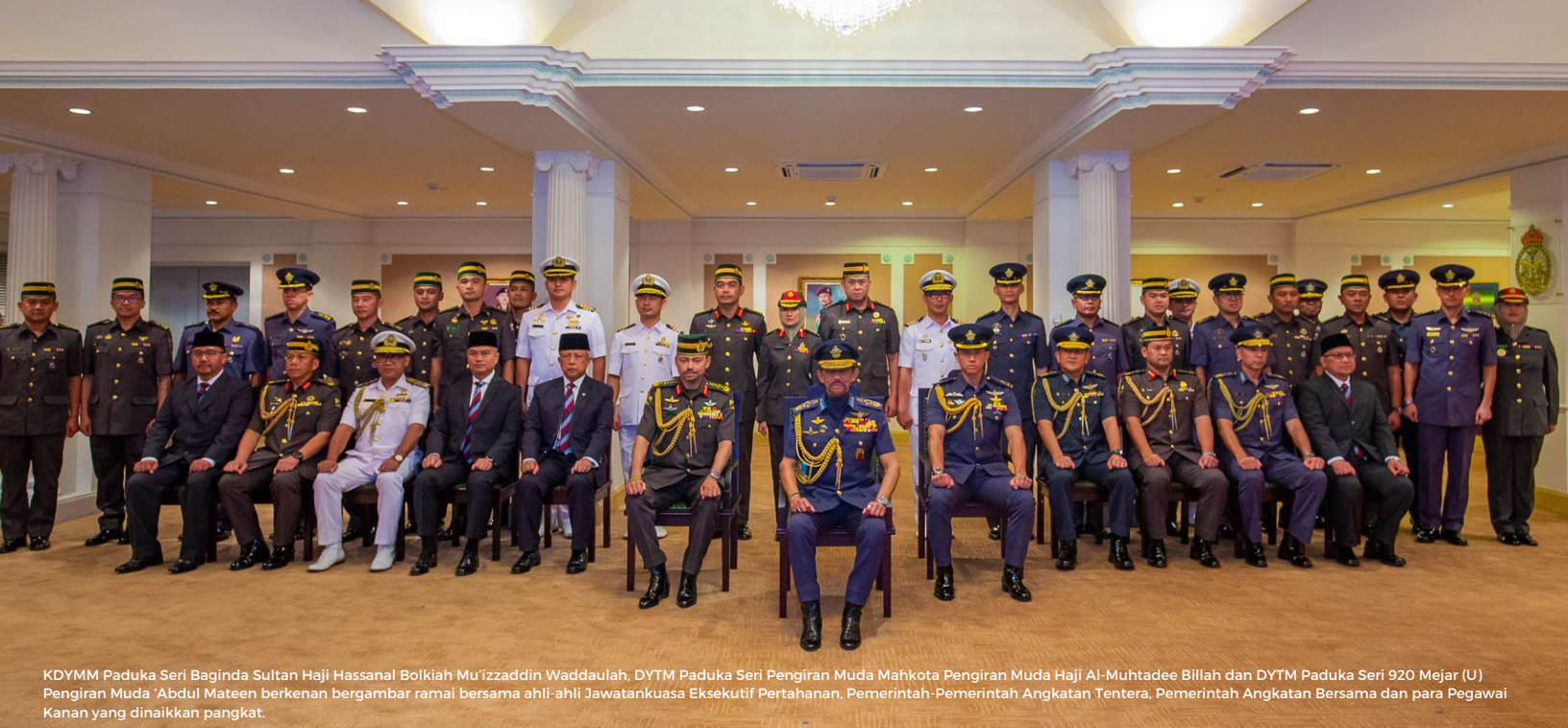
KDYMM Paduka Seri Baginda Sultan Haji Hassanal Bolkiah Mu'izzaddin Waddaulah, DYTM Paduka Seri Pengiran Muda Mahkota Pengiran Muda Haji Al-Muhtadee Billah dan DYTM Paduka Seri 920 Mejar (U) Pengiran Muda 'Abdul Mateen berkenan bergambar ramai bersama ahli-ahli Jawatankuasa Eksekutif Pertahanan, Pemerintah-Pemerintah Angkatan Tentera, Pemerintah Angkatan Bersama dan para Pegawai Kanan yang dinaikkan pangkat.